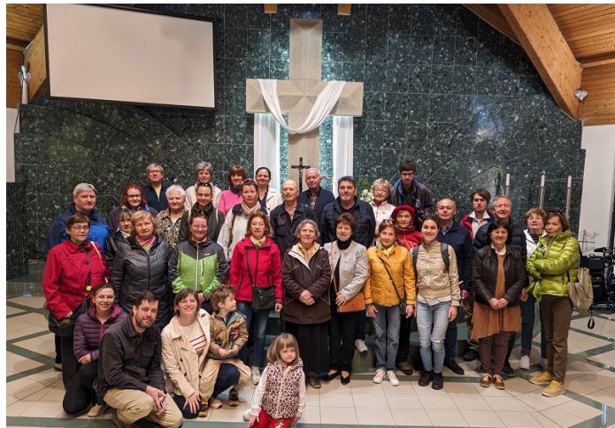
Ekumenické putovanie 2024