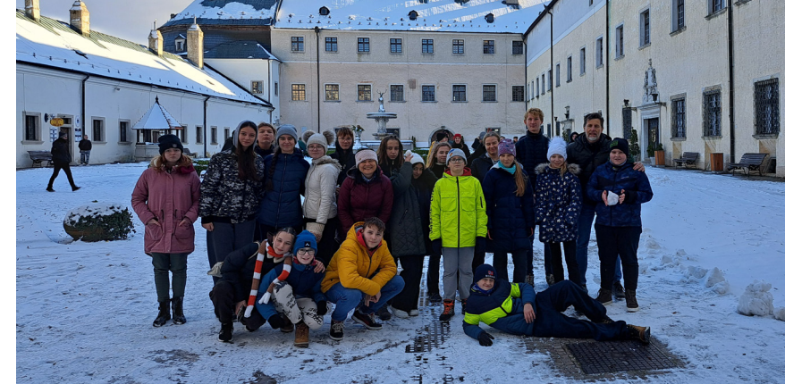
Výlet konfirmandov na Červený kameň 2024

Stredná generácia nesie zodpovednosť za súčasnosť. Mnohí z tejto